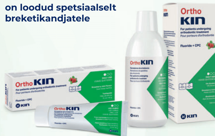
Hambapasta 1450 ppm F -

OrthoKIN tootesari on loodud spetsiaalselt breketikandjatele