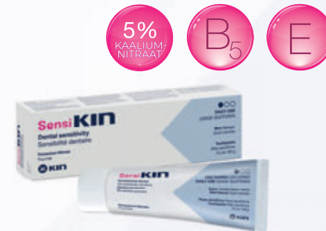
SensiKIN hambapasta 1450 ppm F -

IGAPÄEVANE TUNDLIKKUSE VÄHENDAMINE ⌚ KASUTADA IGA PÄEV