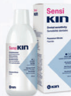
SensiKIN suuvesi 1450 ppm F -

suuvesi + hambapasta: hammaste hooldus kuuma- ja külmatundlike hammaste korral