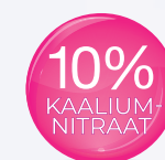
SensiKIN geel kõrge katvusega, mis kindlustab, et toode jõuab vajalikku kohta 1000 ppm F -